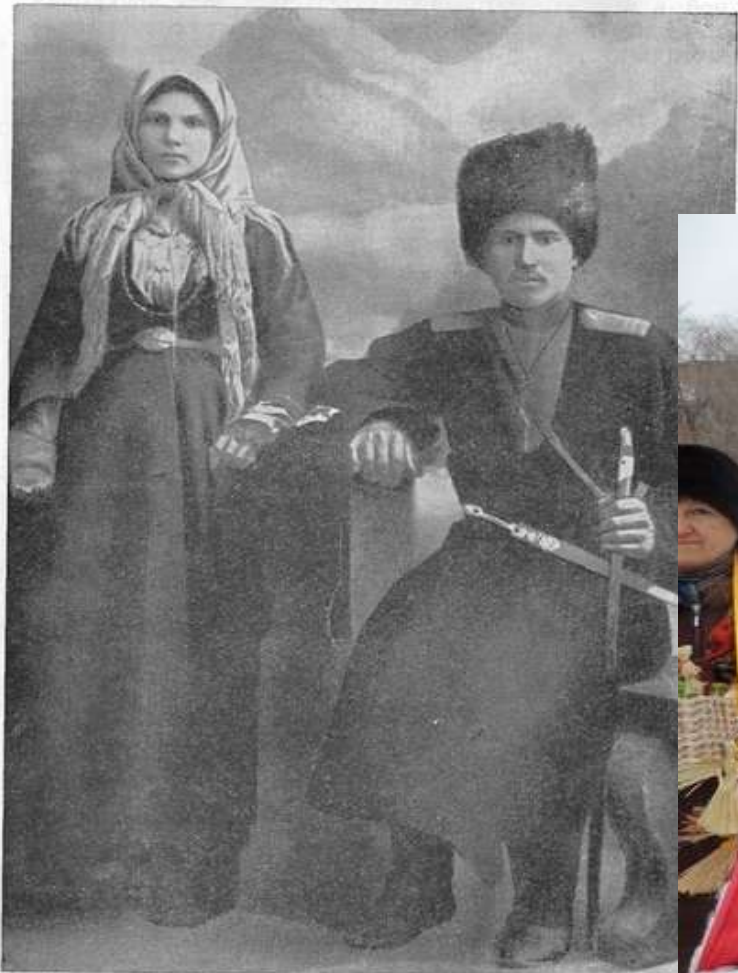
Казак с женой из станицы Гребенской Фото начала XX в. (ЧИРКМ, ос. 8638)

По чести и поведению женщины Мерилось достоинство мужчины.